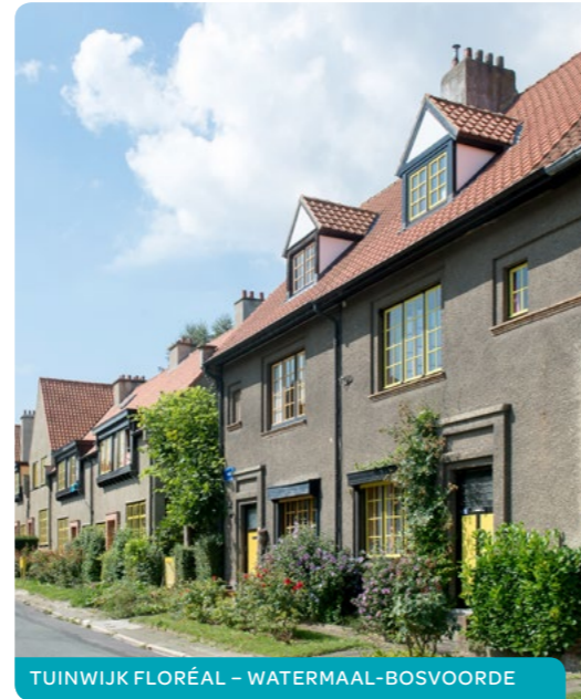
TUINWIJK FLORÉAL - WATERMAAL-BOSVOORDE

Als er geen gevolg werd gegeven aan uw kandidatuur of als u vindt dat uw inschrijving onterecht werd geweigerd, kan u klacht indienen. Daarvoor moet u een aangetekende brief sturen naar de zetel van de betrokken maatschappij of een brief tegen ontvangstbewijs afgeven. Deze procedure wordt bepaald in art. 76 van de Brusselse Huisvestingscode.