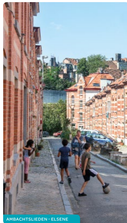
AMBACHTSLIEDEN - ELSENE

Deze bedragen worden verhoogd met 2.217,44€ per kind ten laste en met 4.434,89€ per meerderjarige persoon met een handicap. Een kind ten laste met een handicap = 2 kinderen ten laste.