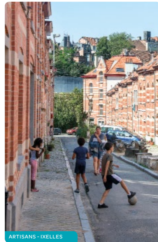
ARTISANS - IXELLES

→ Pour un ménage disposant de deux revenus ou plus : 29.565,98€.*