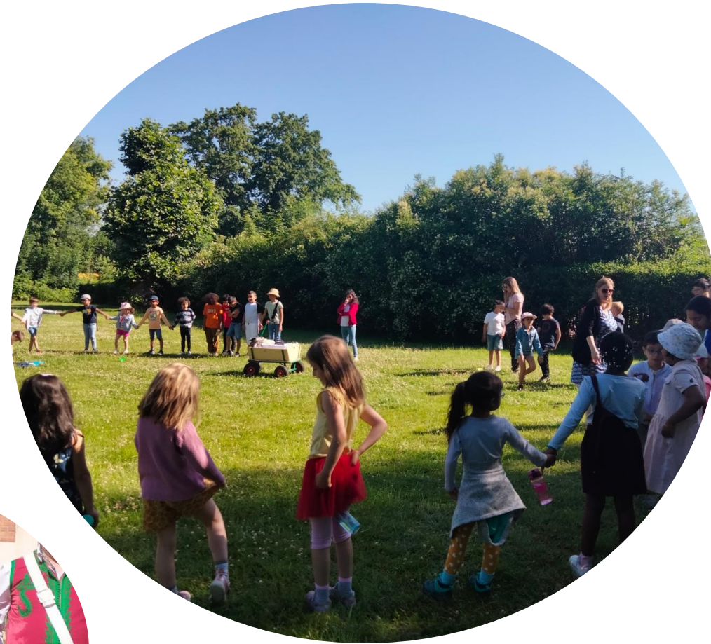
PCS de là Haut