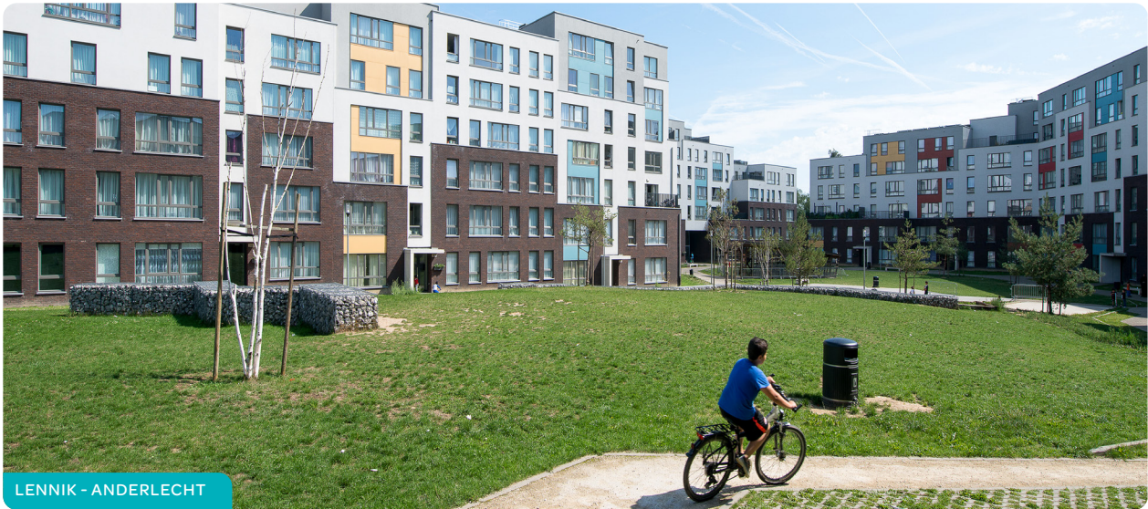
LENNIK - ANDERLECHT