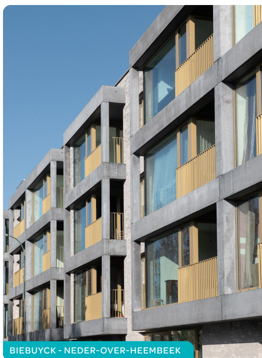
BIEBUYCK - NEDER-OVER-HEEMBEEK

Vous pouvez ajouter ou supprimer à tout moment des SISP et des communes dans votre demande sauf si vous êtes en cours d'attribution d'un logement.