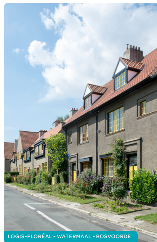
LOGIS-FLORÉAL - WATERMAAL - BOSVOORDE

Deze bedragen worden verhoogd met 2.618,96€ per kind ten laste en met 5.237,91€ per meerderjarige persoon met een handicap. Een kind ten laste met een handicap = 2 kinderen ten laste.