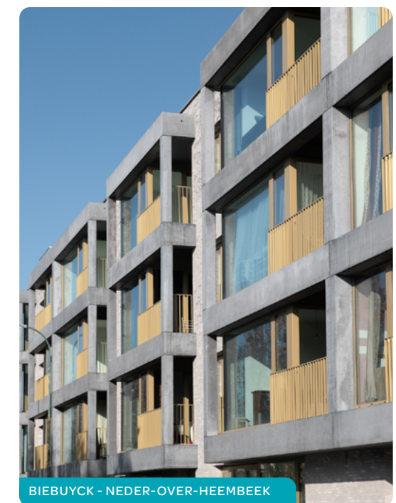
BIEBUYCK - NEDER-OVER-HEEMBEEK

Op ieder moment kan u OVM's en gemeenten toevoegen of schrappen uit uw aanvraag, behalve indien er voor u een toewijzingsprocedure voor een woning aan de gang is.