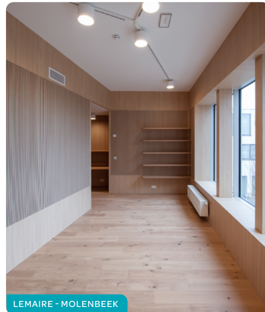
LEMAIRE - MOLENBEEK

Als er geen gevolg werd gegeven aan uw kandidatuur of als u vindt dat uw inschrijving onterecht werd geweigerd, kan u klacht indienen. Daarvoor moet u een aangetekende brief sturen naar de zetel van de betrokken maatschappij of een brief tegen ontvangstbewijs afgeven. Deze procedure wordt bepaald in art. 76 van de Brusselse Huisvestingscode.