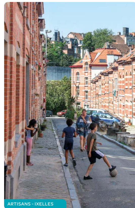
ARTISANS - IXELLES

Ces montants sont augmentés de 2.217,44€ par enfant à charge et de 4.434,89€ par personne majeure handicapée. Un enfant handicapé à charge = 2 enfants à charge.