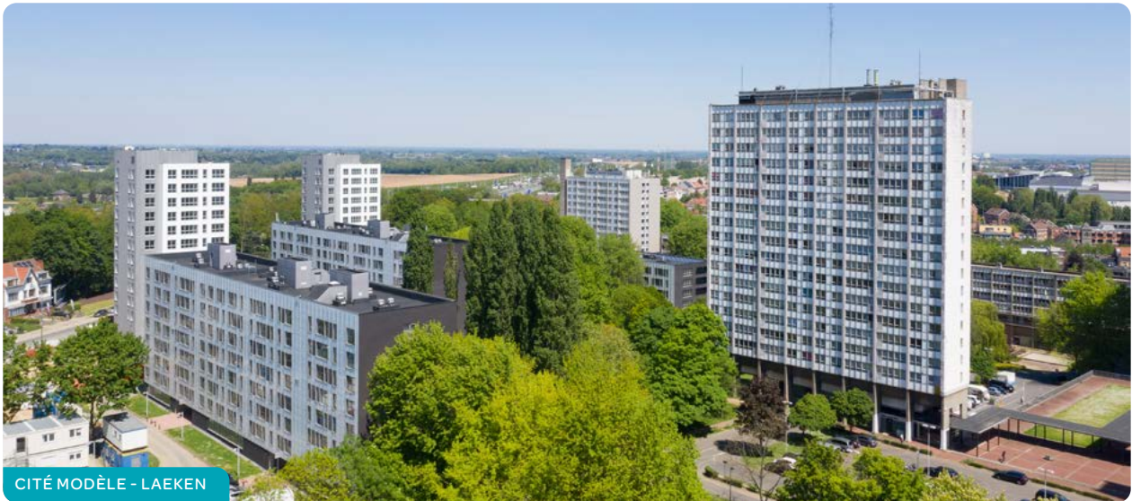
CITÉ MODÈLE - LAEKEN