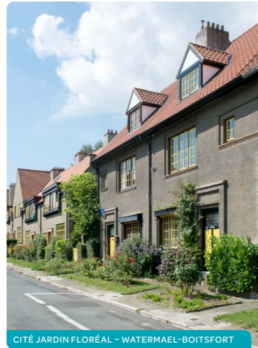
CITÉ JARDIN FLORÉAL – WATERMAEL-BOITSFORT

Si aucune suite n'a été réservée à votre demande ou si vous estimez que le refus d'inscription ne se justifie pas, vous pouvez introduire une plainte par lettre recommandée au siège de la société concernée ou par dépôt contre accusé de réception suivant l'art. 76 du Code bruxellois du Logement.